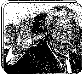
Nelson Mandela, de eerste niet blanke president van Zuid-Afrika

Zuid-Afrika was zo'n kolonie. Blanken en zwarten moesten daar apart wonen. Nelson Mandela heeft hier lang tegen gestreden. Het werd apartheid genoemd. De verschillen zijn nu verdwenen. Mandela is zelfs de eerste zwarte president van Zuid-Afrika geworden in 1994.