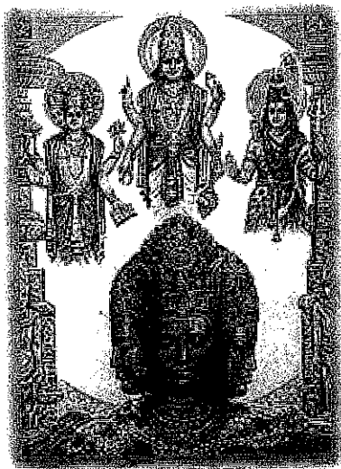
Brahma, de oppergod

De dag begint voor een hindoe met een offer, een soort geschenk aan een god. De oppergod is Brahma, de schepper van de wereld.