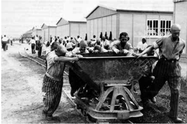
Werken in een concentratiekamp.

In de Tweede Wereldoorlog zijn 6 miljoen joden omgekomen!