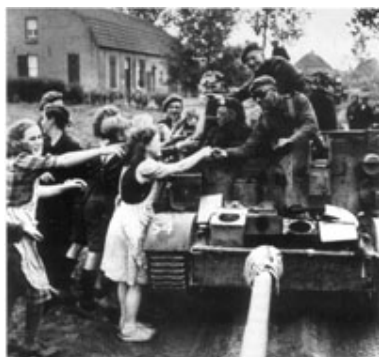
Nederland wordt in 1945 bevrijd.

De oorlog tegen Japan duurde tot augustus 1945. De Amerikanen verwoestten met atoombomben de Japanse steden Hiroshima en Nagasaki.