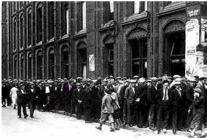
In de rij voor 'steun'. Je kreeg dan geld van de regering.

Na de oorlog ging het steeds slechter met Europa. De werkloosheid was zo groot dat we de periode tussen 1930 en 1940 de crisisjaren noemen. De werklozen hadden met 'steun' (geld van de regering) net genoeg te eten. Maar omdat niemand producten kon kopen, moesten winkels en fabrieken meer mensen ontslaan. En zo kwamen er nog meer werklozen!